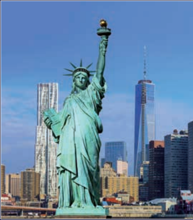
América Norte & Sur