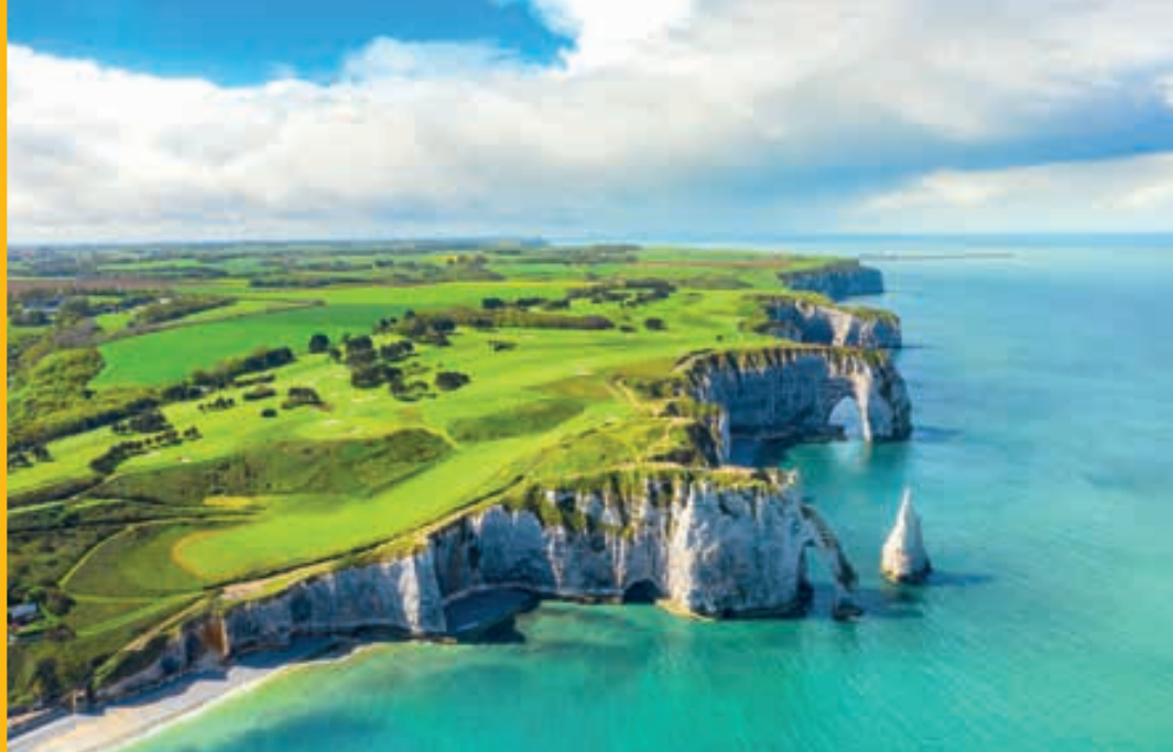
Acantilados de Etretat, NORMANDÍA.

Abril: 7, 14, 21, 28 Mayo: 5, 12, 19, 26 Junio: 2, 9, 16, 23, 30