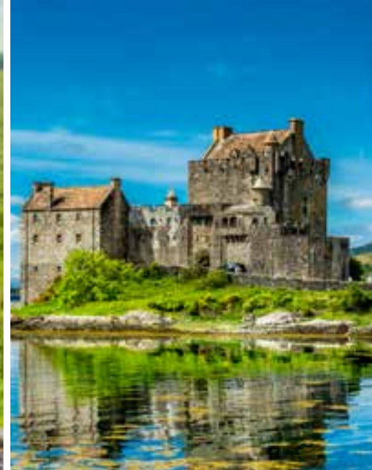
Castillo Eilean Donan. Isla de Sky.

Todo lo que no esté expresamente incluido en el itinerario.