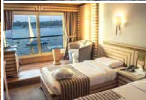
Barco Princess Sarah 5*****