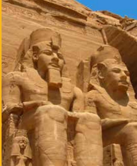
Templo de Abu Simbel. ASSUAN.