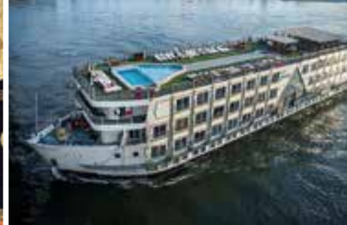
Barco Princess Sarah 5****