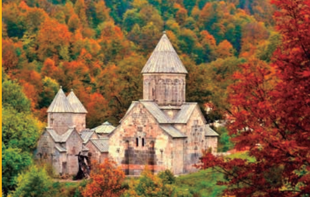
Monasterio de Haghartsin. ARMENIA.