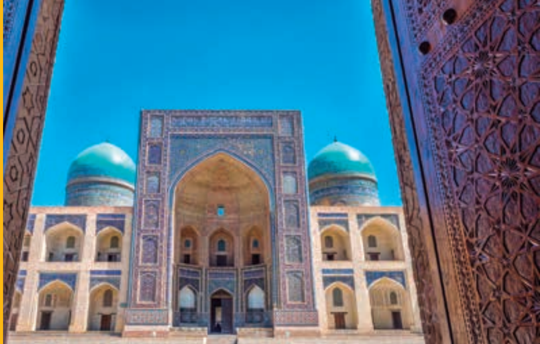
Madrasa Miri Arab. BUKHARA