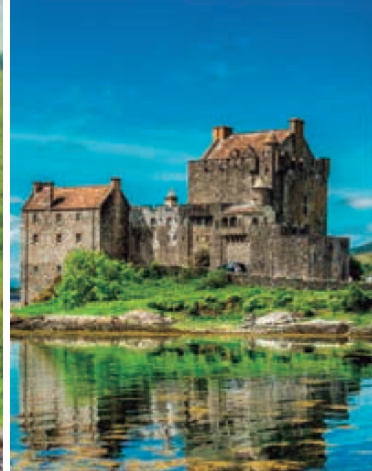
Castillo Eilean Donan. Isla de Sky.