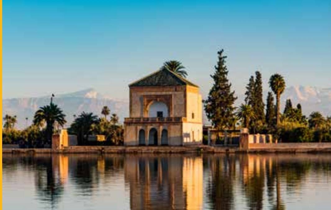
Pabellón Saadiano, Marrakech. MARRUECOS.