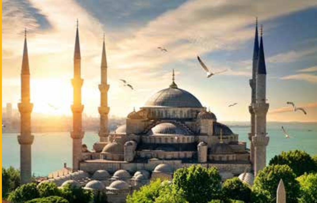
Mezquita Azul y el Bósforo. ESTAMBUL.