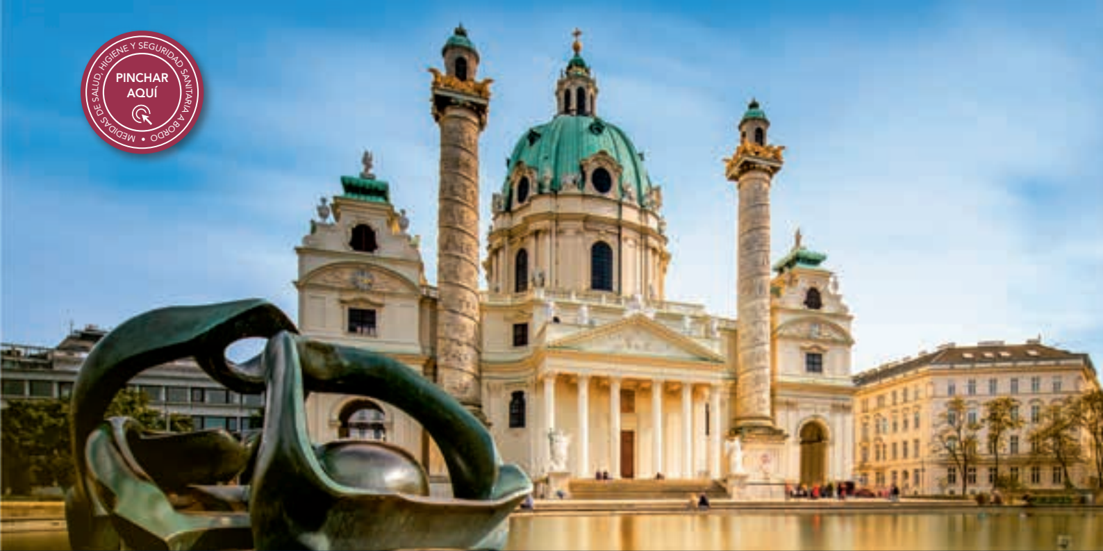
Viena: Catedral barroca de San Carlos