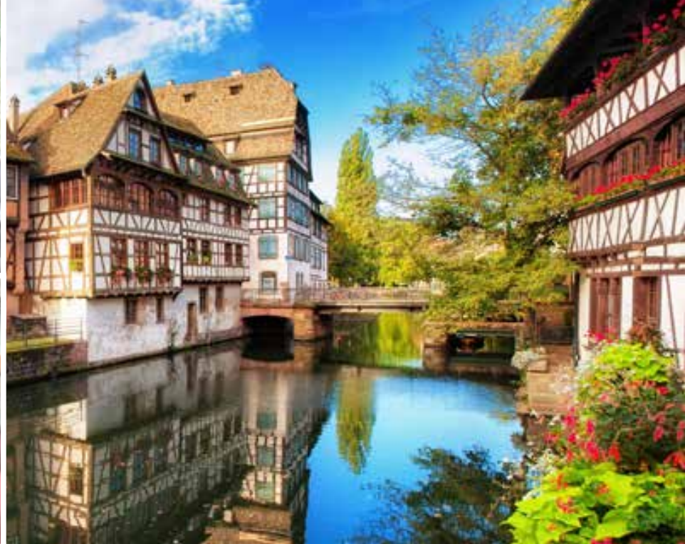
Petite France, Estrasburgo.