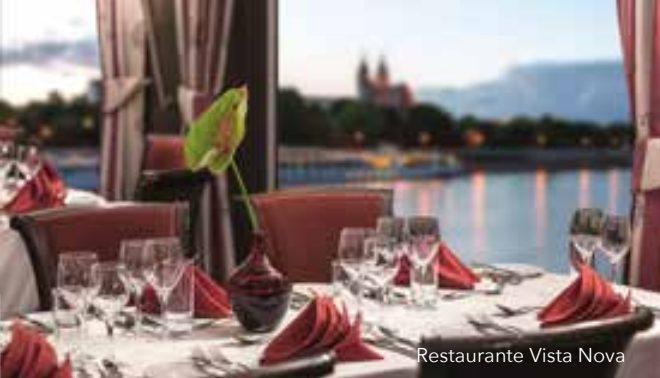
Restaurante Vista Nova