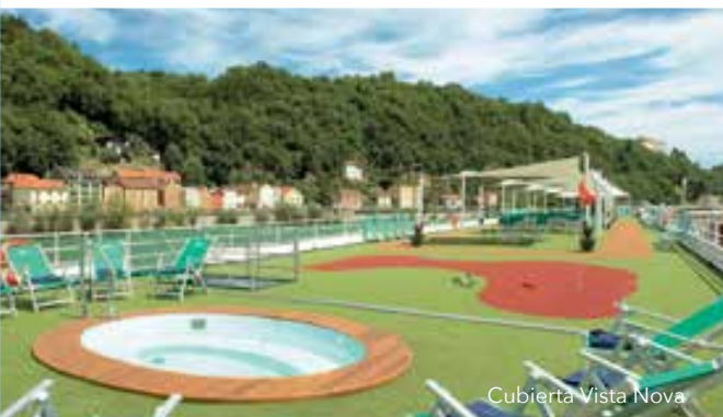
Cubierta Vista Nova