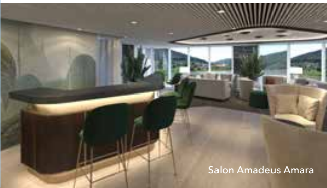
Salon Amadeus Amara