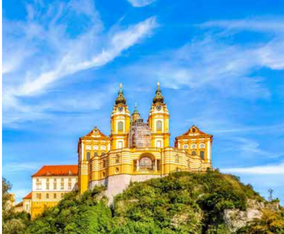
Abadía de Melk. Austria.