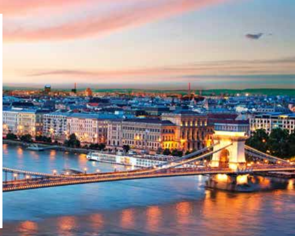
Puente de las cadenas. Budapest.