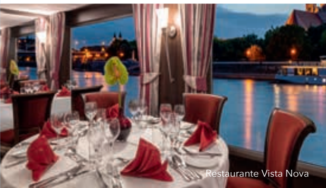
Restaurante Vista Nova