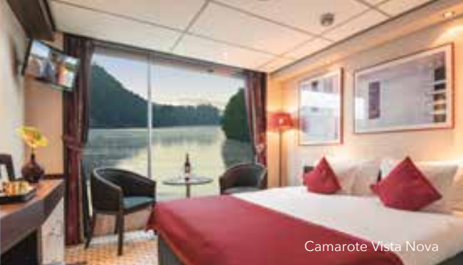
Camarote Vista Nova