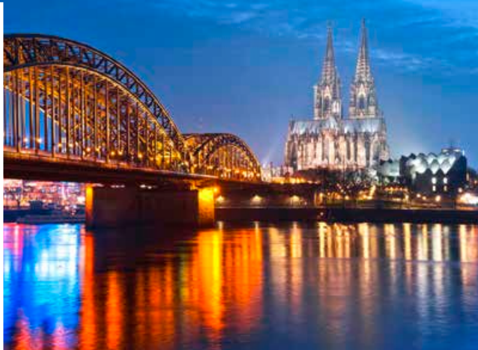
Catedral de Colonia. Alemania.