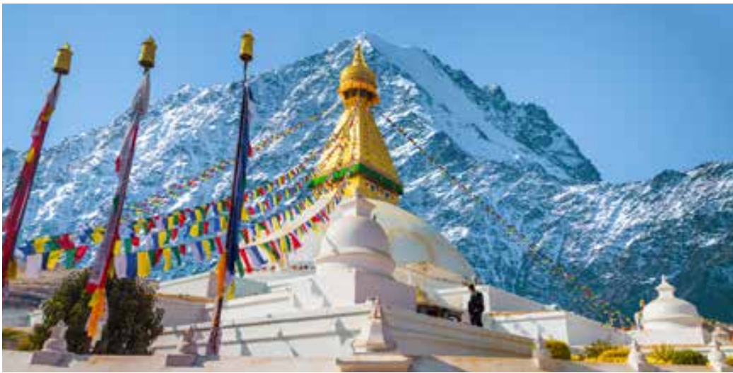
Stupa Bodhnath. Kathmandu

tencia a la ceremonia Aarti en el templo Birla , un ritual hindú de gran simbolismo en el que la luz y el sonido crean una experiencia espiritual única. Cena y alojamiento.