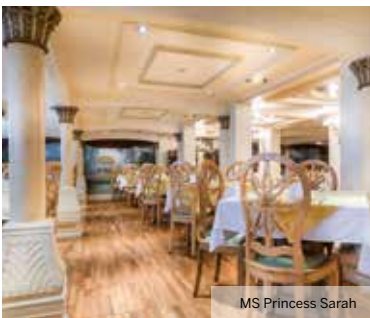
MS Princess Sarah