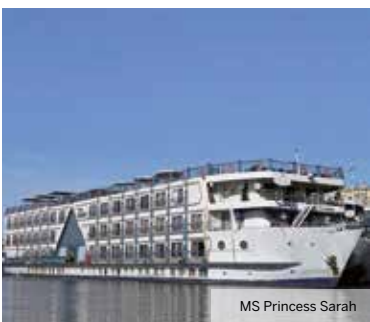
MS Princess Sarah