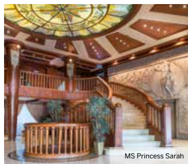
MS Princess Sarah