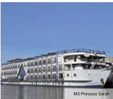
MS Princess Sarah