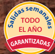
Desierto de Wadi Rum