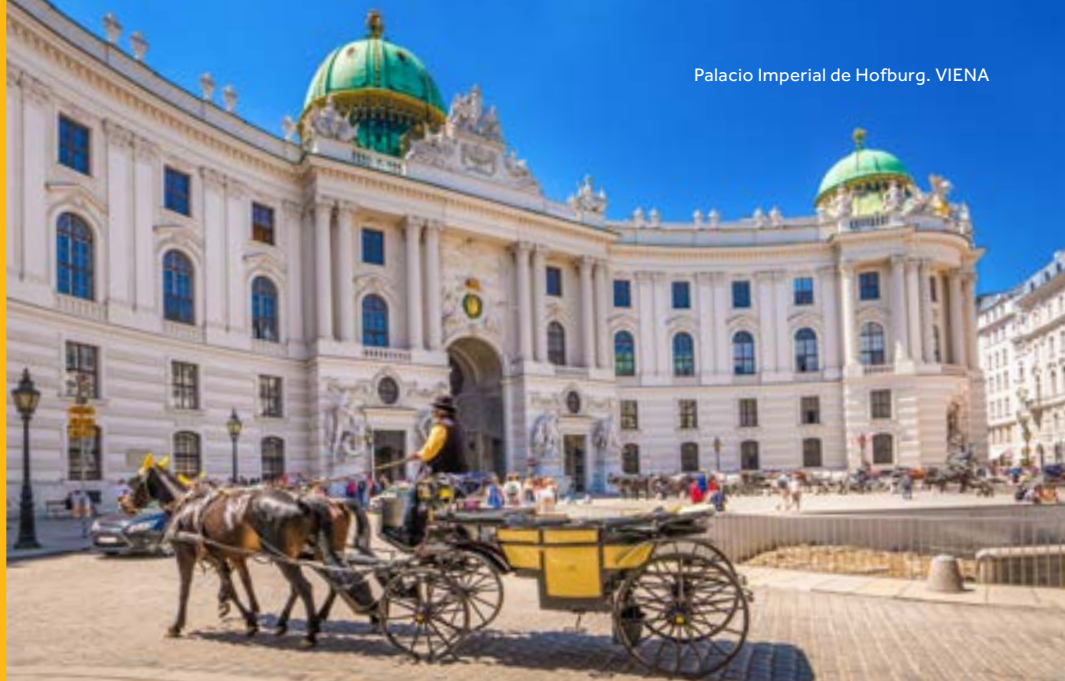
Palacio Imperial de Hofburg. VIENA