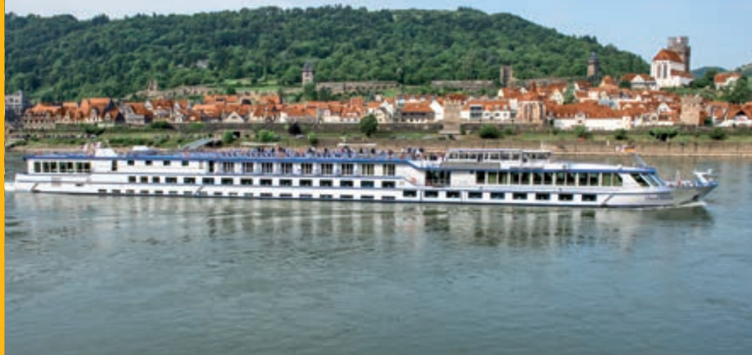
Ms Dutch Melody 4****