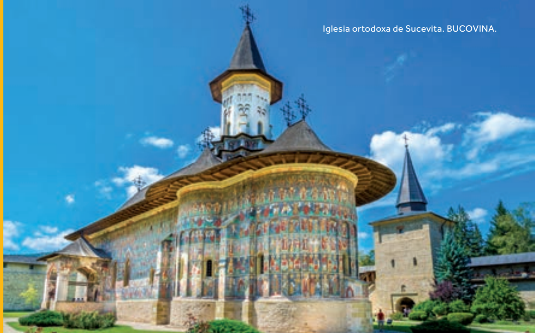
Iglesia ortodoxa de Sucevita. BUCOVINA.