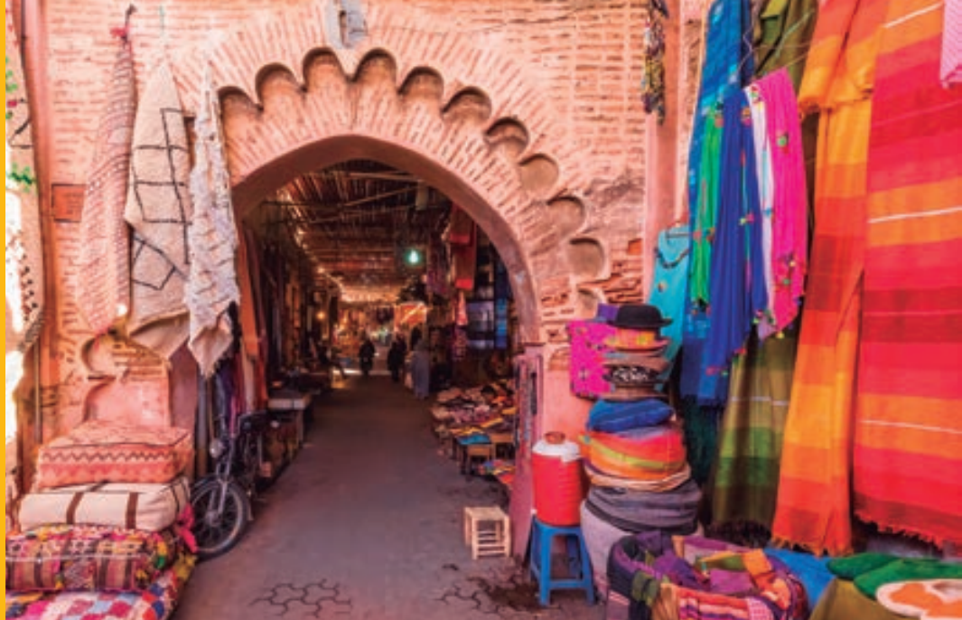
Vieja Medina. MARRAKECH