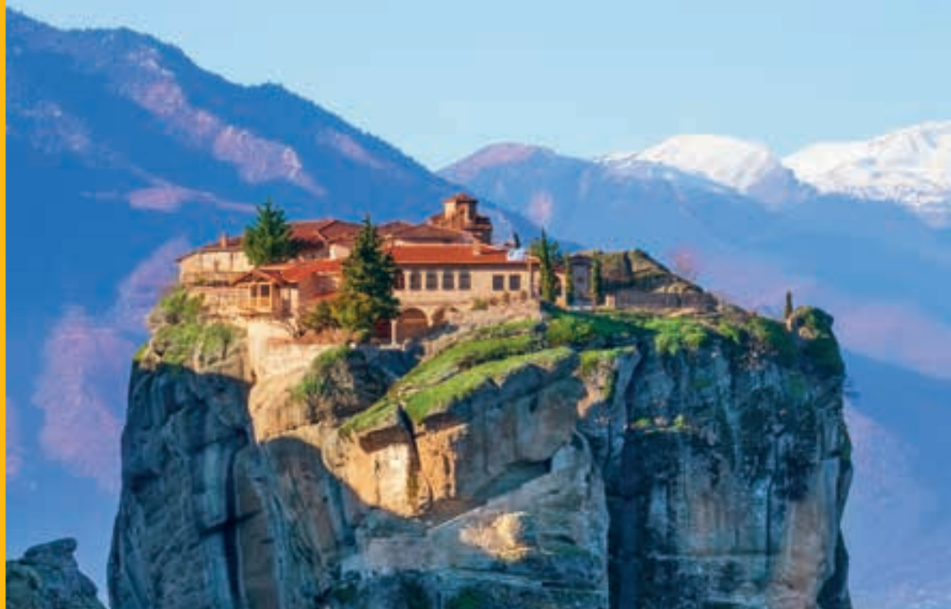
Monasterio de Meteora. GRECIA.

Marzo: 17 Abril: 14, 21 Mayo: 5, 19 Junio: 2, 16