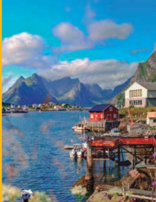
Islas Lofoten. NORUEGA.