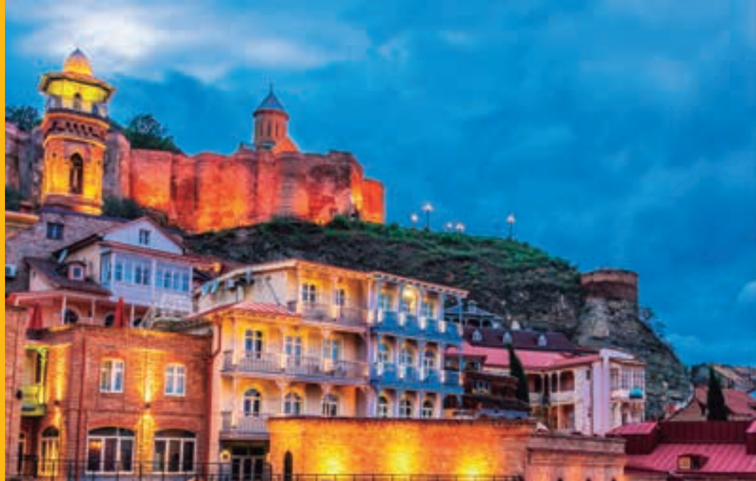
Casco antiguo de Tiflis. GEORGIA.