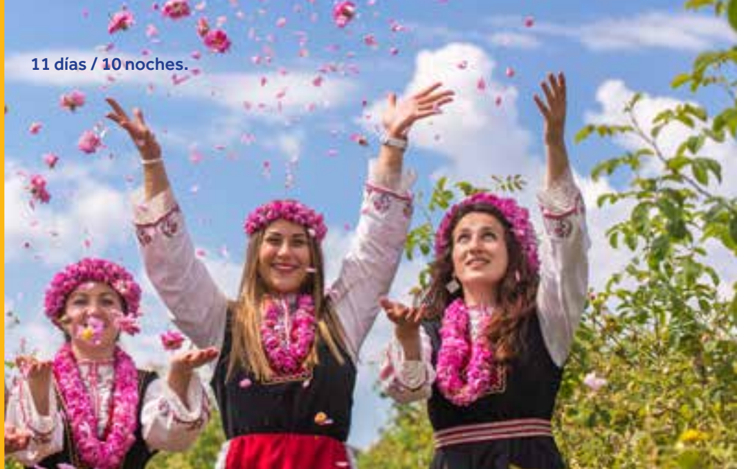
Festival de la Rosa. BULGARIA.