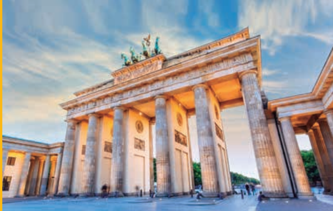
Puerta de Brandeburgo, Berlín. ALEMANIA.